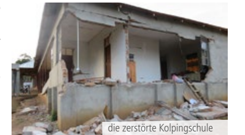
die zerstörte Kolpingschule

Verwendungszweck: „Erdbeben in Tansania“ senden. Von dort wird es vom Diözesankassier an das Internationale Kolpingwerk weitergeleitet.