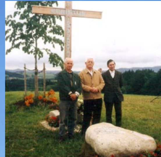
Maiandacht am Geispiel